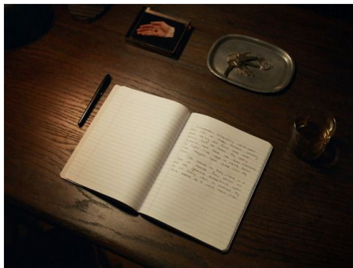
First Reformed, Paul Schrader (2018)

Paul (49): (Inspiratie: Jean-Paul Sartre) Hij is een professor in de filosofie. Geeft masterclasses over Heidegger. Hier schreef hij in zijn tijd ook zijn doctoraat over, alsook later enkele boeken. Zijn onderzoek wordt erg gewaardeerd in de academische wereld en hij is dan ook een heel gerespecteerd man. Toch wou hij eigenlijk in de eerste plaats altijd romanschrijver worden en geen filosoof. Hij houdt ervan dat alles heel proper is, dat alles recht ligt en dat er onder een glas een onderzetter staat.