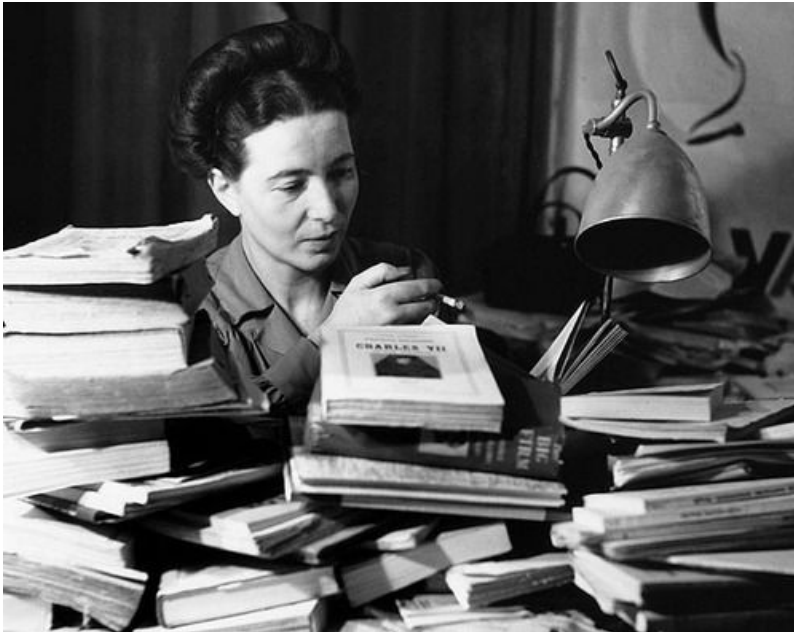
Simone De Beauvoir aan haar bureau

voor haar. Het deed hem wel pijn toen ze vertrok. Wanneer ons verhaal begint, wanneer ze dus net terug is en hem opbelt, weet hij niet goed hoe hij hiermee moet omgaan. Hij durft haar niet echt toe te laten en kan er niet goed tegen dat zijn routine doorbroken wordt.