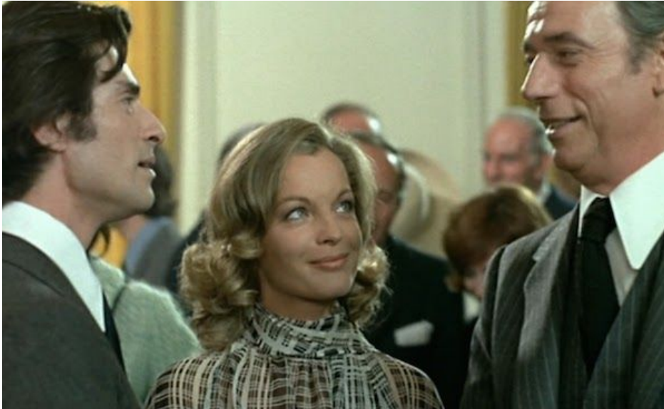
César et Rosalie, Claude Sautet (1972)

omdat hij erg veel vriendinnetjes had. Hoe meer ik las over en van Sartre kwam er echter steeds vaker naar boven dat hij helemaal geen lichamelijk persoon was. Dit inspireerde mij om het personage van Paul aseksueel te maken. Aseksuelen zijn mensen die weinig tot geen seksuele aantrekkingskracht of verlangens voelen. Ik vind dit ook interessant omdat dit iets is waar nog maar weinig over gesproken wordt, en al zeker niet vaak in beeld werd gebracht. Ik denk dat voor veel mensen dit zowat de belangrijkste aspecten zijn van een relatie; exclusiviteit en lichamelijkheid. Als dit wegvalt, wat schiet er dan nog over? Wat maakt deze relatie dan nog de moeite waard?