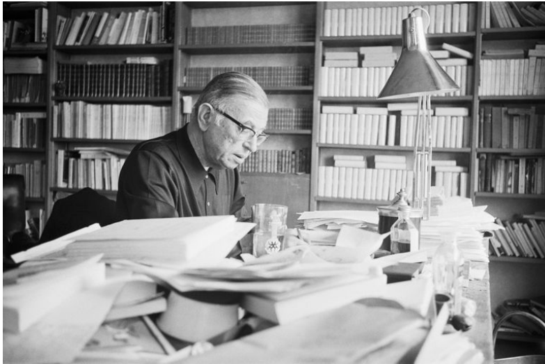
Jean-Paul Sartre aan zijn bureau