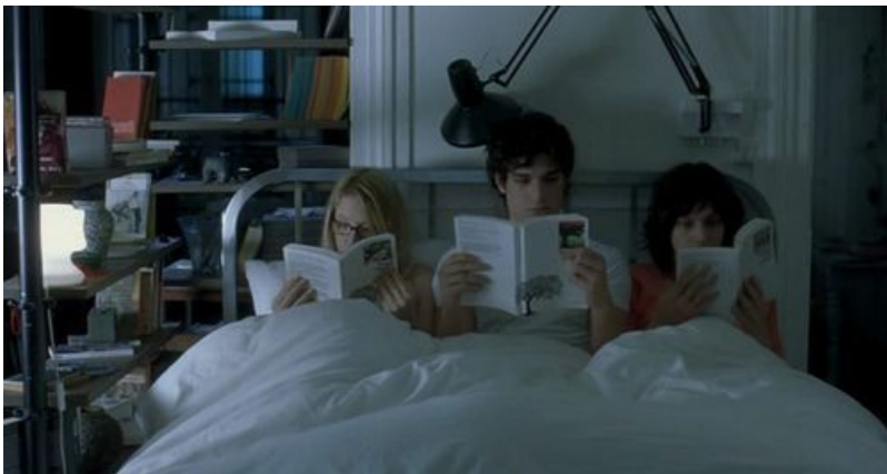
Les chansons d'amour, Christophe Honoré (2007)

Zoals ik al eerder aanhaalde, heb ik een grote liefde voor de Franse cinema van de jaren '70 - '80. Ik wil dat dit ook duidelijk wordt in de visuele stijl van de film, om zo ook een link te maken met Sartre en De Beauvoir, wiens leven zich ook in het Parijs van die tijd afspeelde. Een grote inspiratie is de Franse regisseur Christophe Honoré, een regisseur van deze generatie, maar wiens films erg in die lijn liggen. Hij weet op een unieke manier romantiek vast te leggen. Een mengeling van goede dialogen, blikwisselingen en mooie mise-en-scène shots. En het musical-aspect - dat hij in Les Chansons d'amour volledig doortrekt - draagt daar ook zeker tot bij.